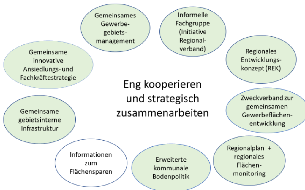
Abbildung 4: Integrierter Ansatz „eng kooperieren und strategisch zusammenarbeiten“

Besonders wirksam sind schließlich integrierte Ansätze, die die Kooperation zwischen den Kommunen der Region verbessern, und zwar sowohl über informelle Gremien wie Fachgruppen oder formelle Verträge wie einen Zweckverband zur gemeinsamen Gewerbeflächenentwicklung. Flächensparen wird in einem solchen kooperativen und strategischen Gewerbeflächenmanagementansatz außerdem durch regionales Flächenmonitoring und Flächenentwicklungsberichte deutlich gefördert.