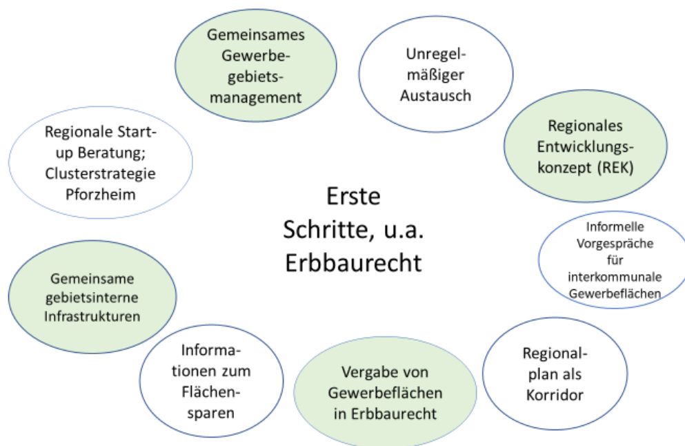
Abbildung 2: Integrierter Ansatz „Erste Schritte, u.a. Erbbaurecht“

Ein erster möglicher Ansatz ist die Kombination der genannten grundlegenden Stellschrauben sowie erste Schritte zur Stärkung des Flächensparens über die Vergabe von Gewerbeflächen im Erbbaurecht.