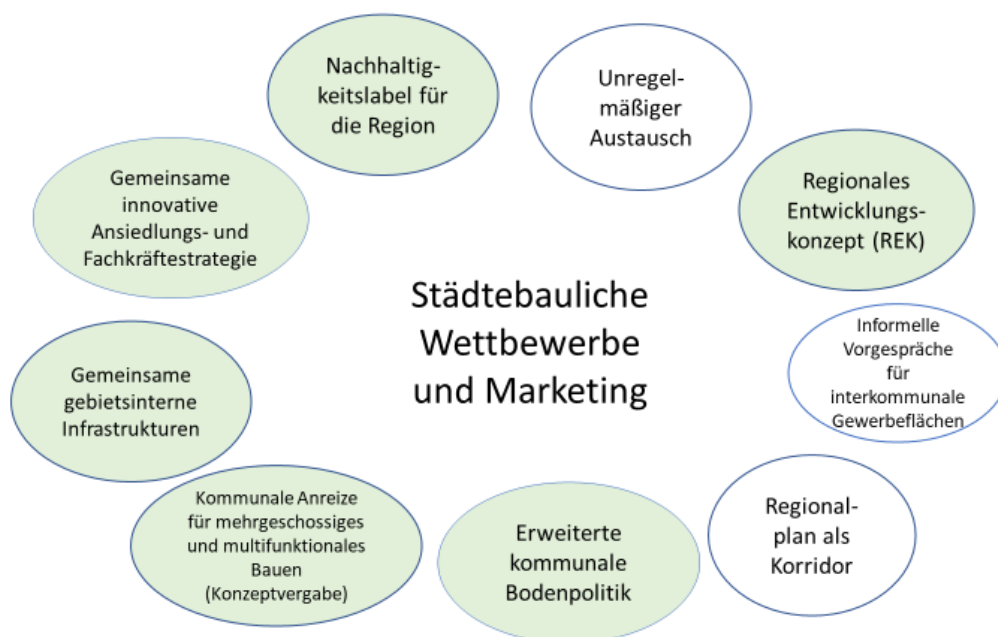
Abbildung 3: Integrierter Ansatz „Städtebauliche Wettbewerbe und Marketing“

Ein weiterer möglicher Ansatz sind z. B. städtebauliche Wettbewerbe in Kombination mit einem Nachhaltigkeitslabel für Gewerbegebiete. Dieser Ansatz bedarf einer erweiterten kommunalen Bodenpolitik und wird durch eine gemeinsame innovative Ansiedlungs- und Fachkräftestrategie unterstützt.